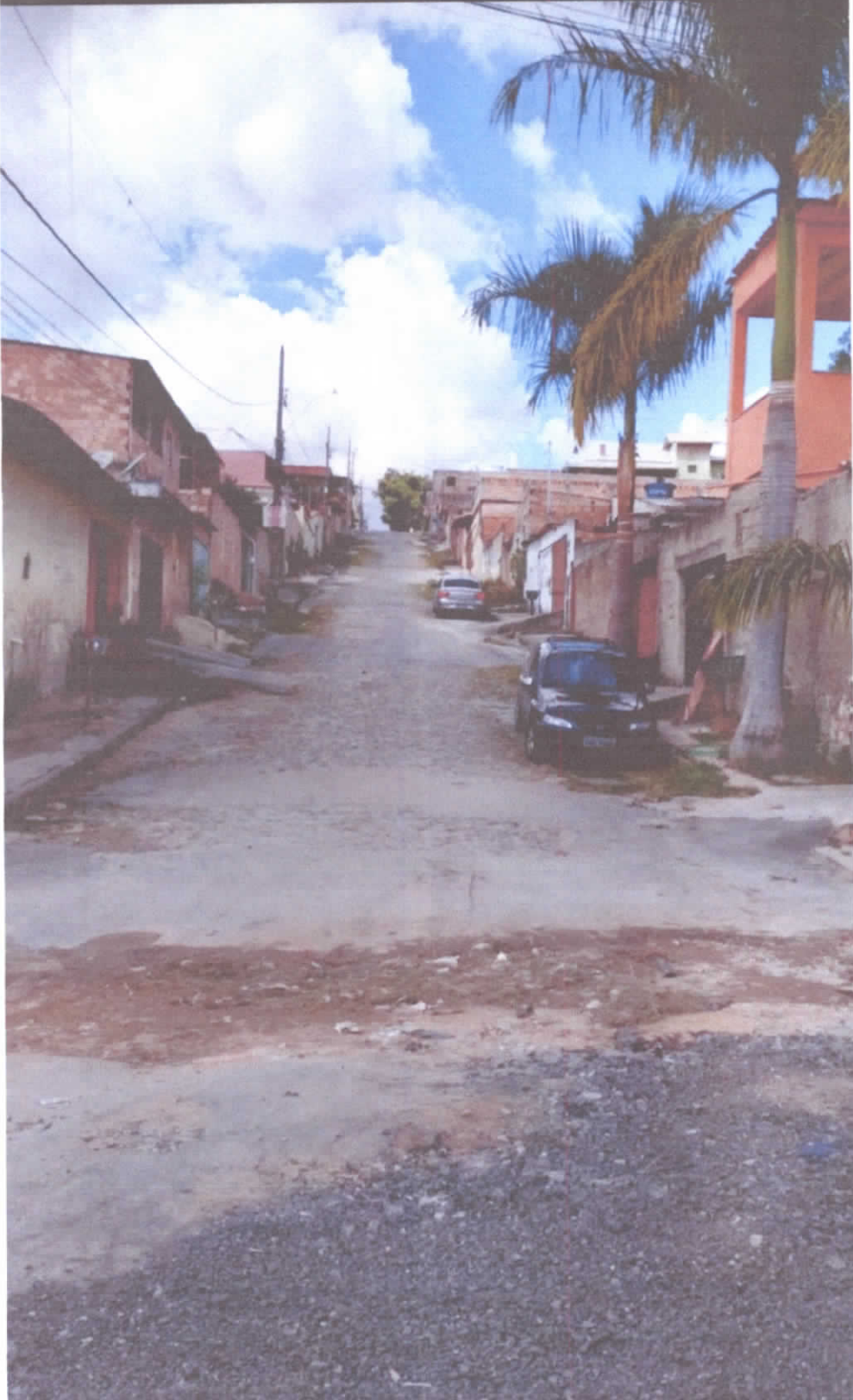
Rua Grécia, conjunto Henrique Saporì