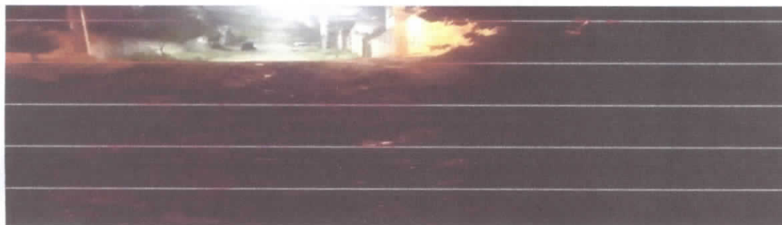
JACARANDAS SUBINDO A RUA FLAMBOYANT