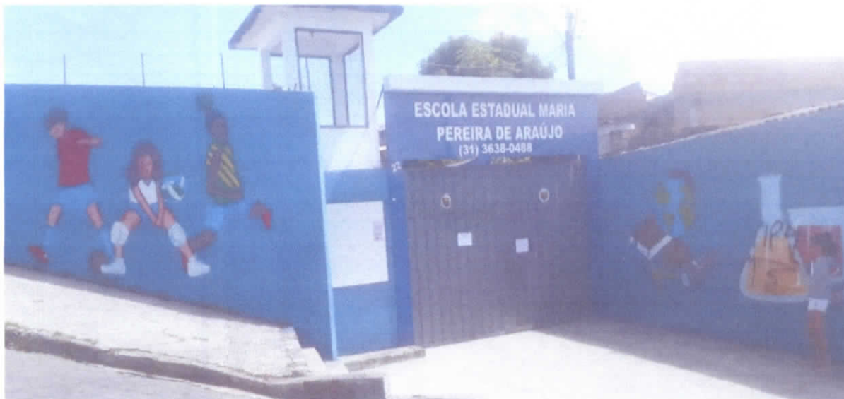
ESCOLA ESTADUAL MARIA PEREIRA DE ARAUJO