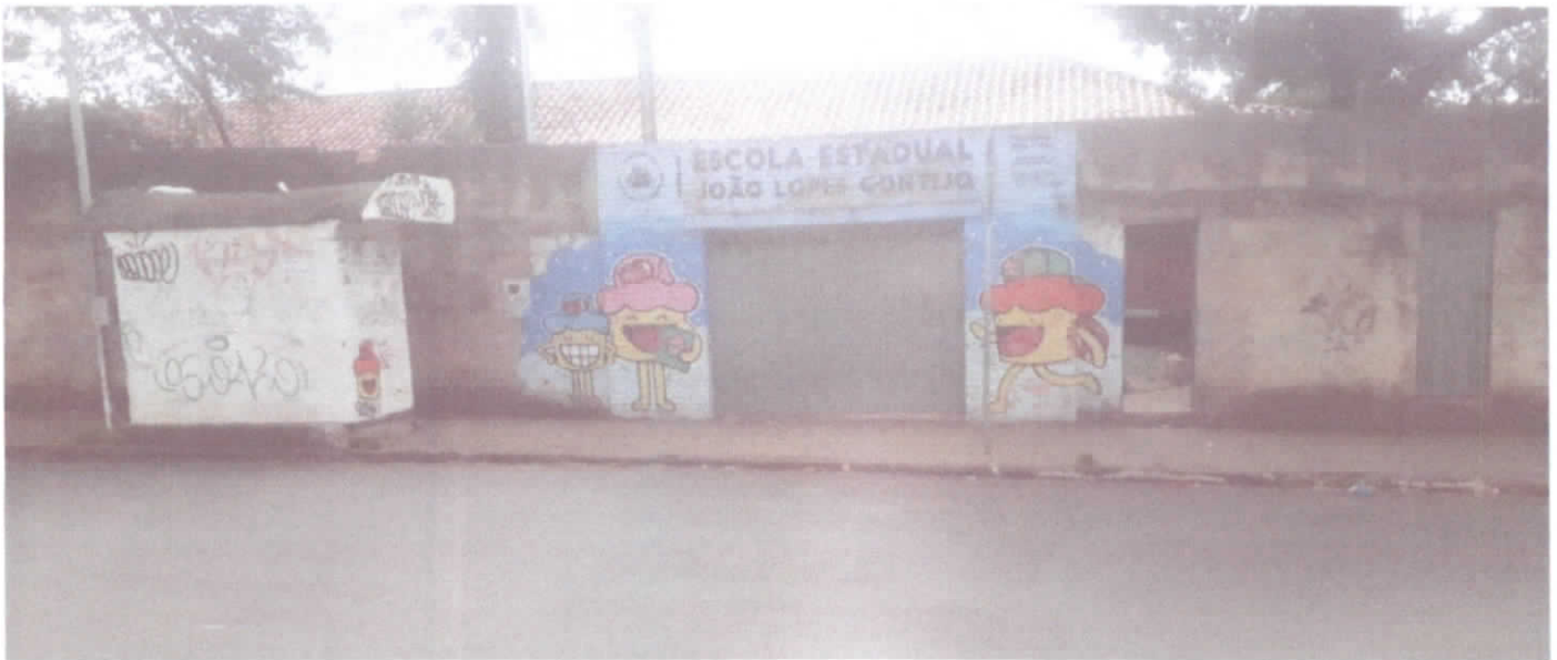
ESCOLA ESTADUAL JOÃO LOPES GONTIJO