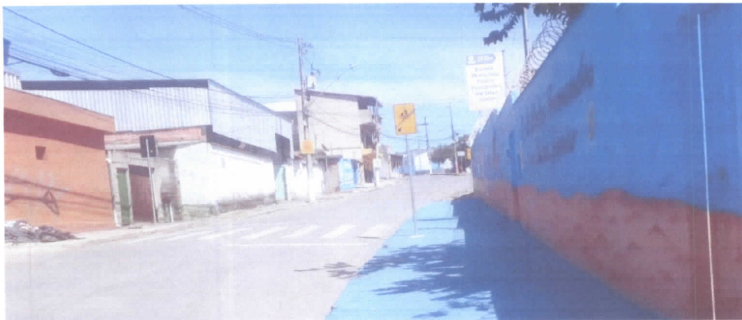
Escola Municipal Pedro Fernandes Da S. Júnior