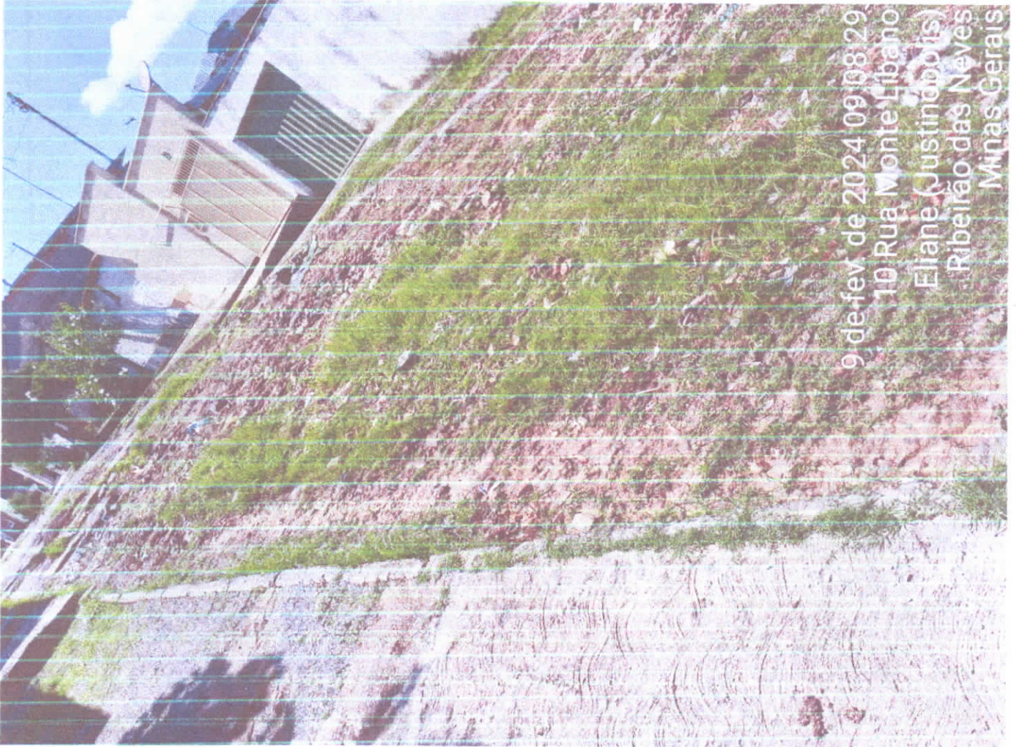
9 de fev de 2024 09:08:29 10 Rua Monte Libano Eliane (Justindopolis) Ribeirão das Neves Minas Gerais