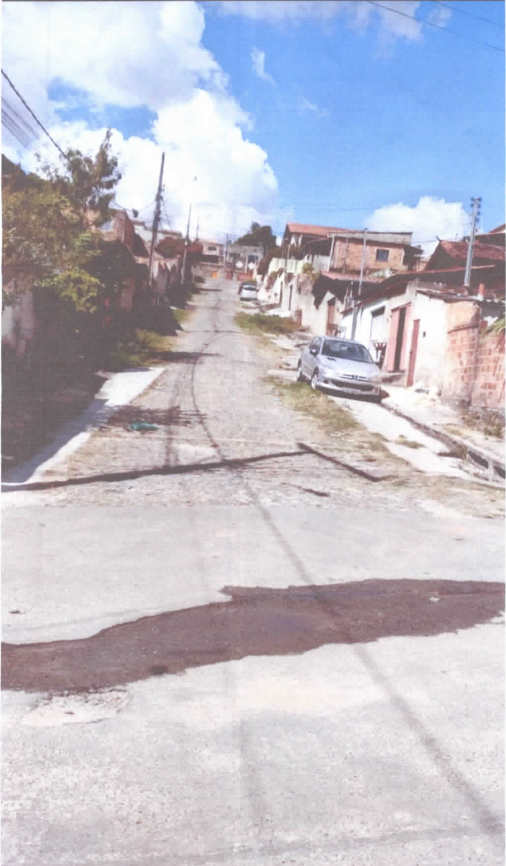
Rua França , conj. Henrique Saporì.